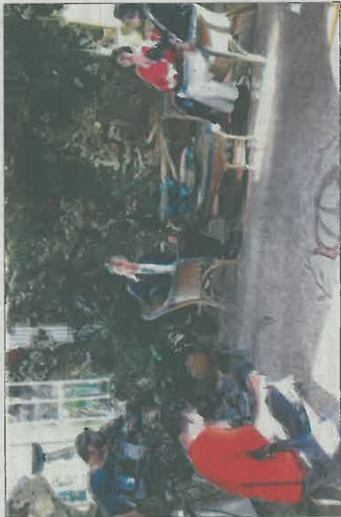
Le reportage a été tourné la semaine dernière au château Bonnet, à Grézillac.

La semaine dernière, France 3 Aquitaine a baladé ses caméras du côté du château Bonnet, à Grézillac. Un domaine de la famille Lurton, à laquelle l'émission « Enquête de régions » consacra son premier numéro. « Pour cette rentrée, "Enquête de régions" propose de découvrir l'Aquitaine à travers les sagas de grandes familles avec des récits qui dépassent largement le cadre familial. Eric Perrin propose de lever le voile sur des personnalités hors du commun, parfois dans la lumière, d'autres plus discrètes, mais aussi